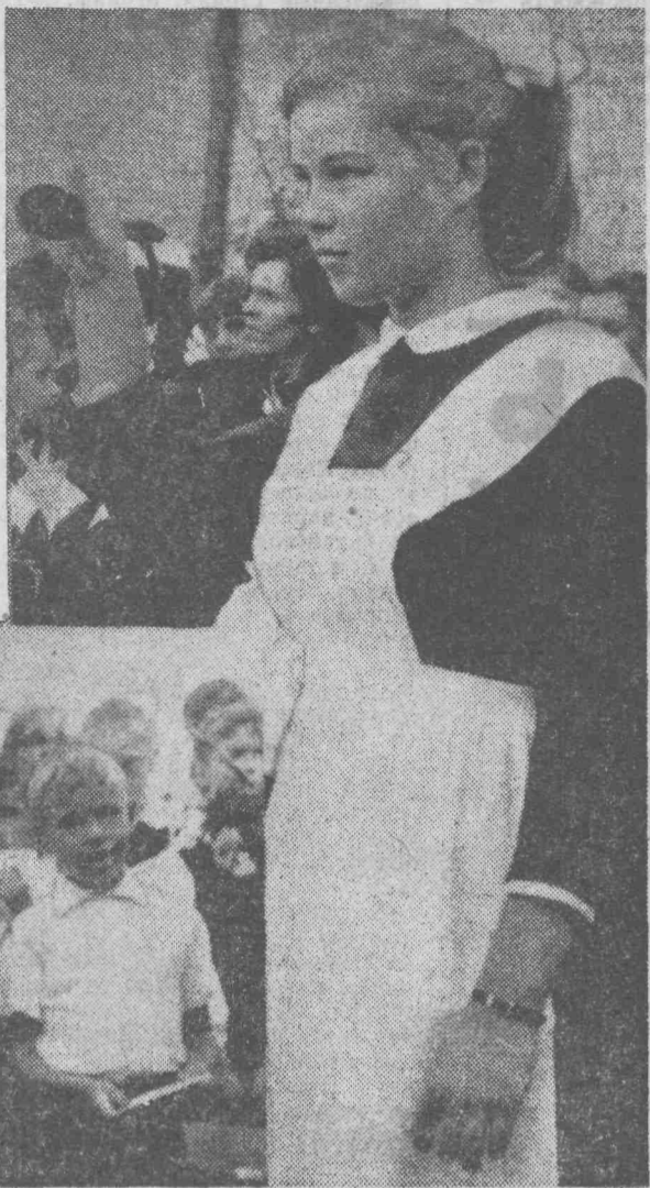
Фото и текст А. Вострикова.

На снимках: первоклассник рассказывает стихок и Наташа Иванова дает первый звонок.