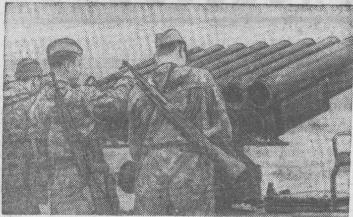
На снимке: воины гвардейской Краснознаменной ордена Суворова Таманской мотострелковой дивизии на учениях. Расчет готовит к стрельбе реактивную установку.