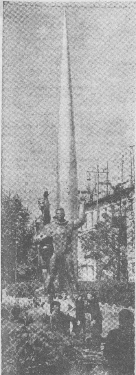
Новой скульптурной группой украсилась улица Ломоносова.

Итак, внедрен еще один комплекс на руднике. На шахте «Журинка-3» он первый. Лаву № 57, оборудованную ОМКТ, отрабатывают горняки пятого участка.