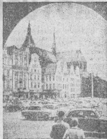
ГДР. Площадь имени Эрнста Тельмана в Ростове.