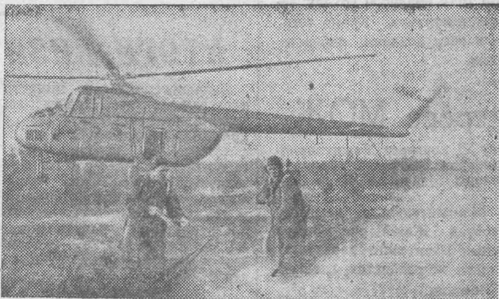
Тюменская область. От Полярного круга до стен Казанской крепости, равной

двум миллионам квадратных километров, ведет свою работу одна из крупнейших в стране Уральская база авиационной охраны лесов. Благодаря отличной работе оперативных отделений базы по ликвидации пожаров в тайге миллионы кубометров леса сохранены для народного хозяйства страны.