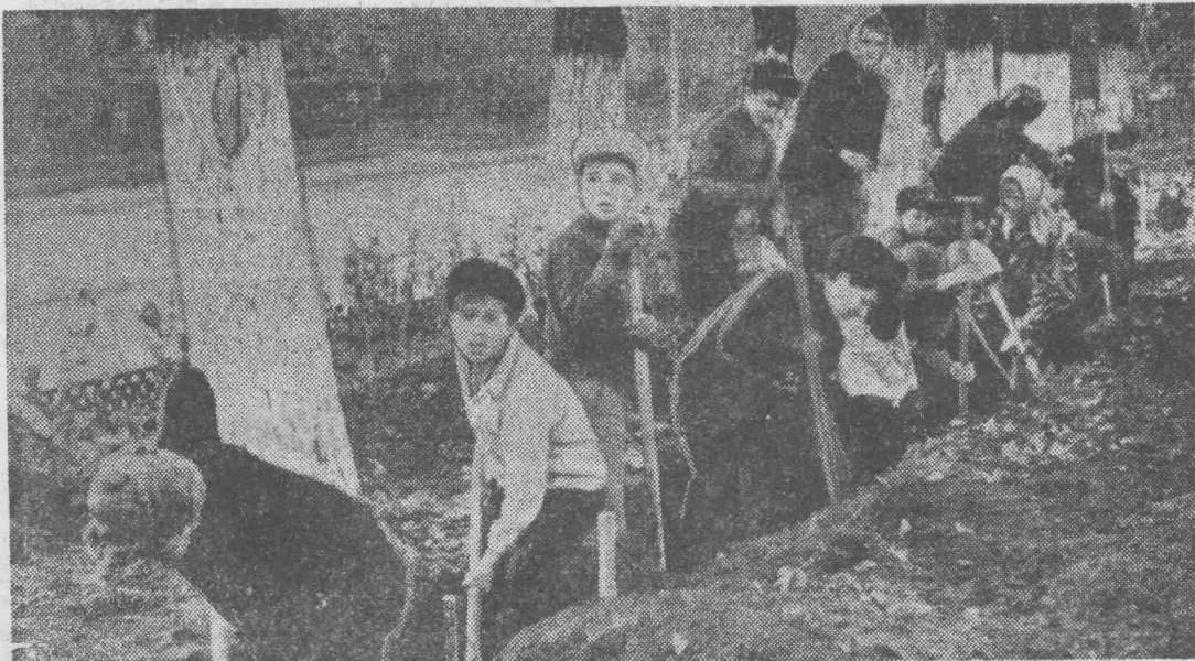
Более двух тысяч комсомольцев города участвовало во Всесоюзном трудовом воскреснике солидарности с борющимся Вьетнамом. Средства от воскресника пойдут в фонд помощи Вьетнаму.

Продажа книг будет организована во всех книжных магазинах, на крупных шахтах и заводах, в средних и восьмилетних школах, техникумах.