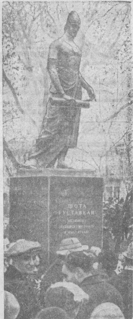
В Москве открыт памятник великому грузинскому поэту и мыслителю Шота Руставели.