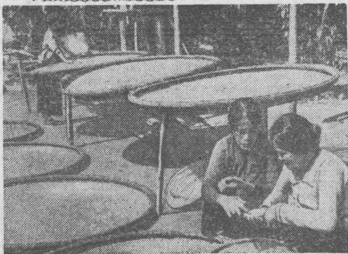
Демократическая Республика Вьетнам. В сельскохозяйственном кооперативе Винь Ким в районе Виньлинь собран небывалый урожай риса. Каждый гектар дал здесь в среднем 2,9 тонны зерна.