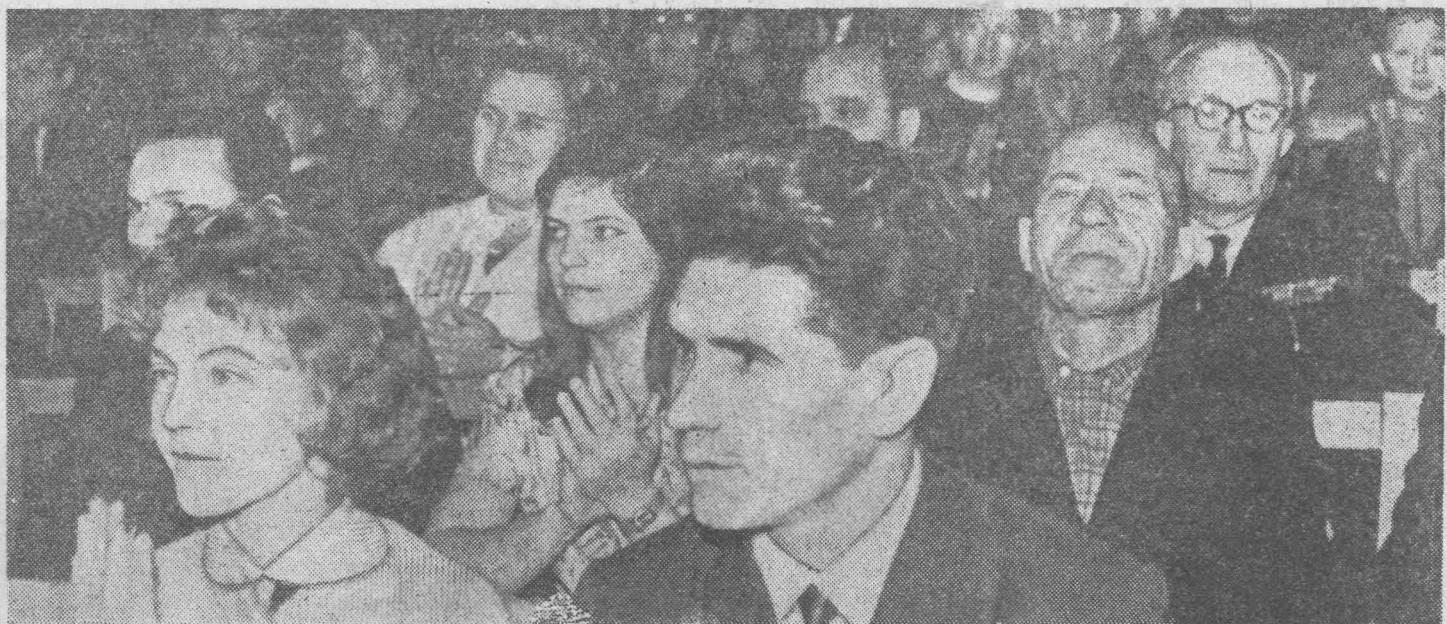
5 ноября в ЦДК состоялось городское торжественное заседание, посвященное 49-й годовщине Октября. На снимке: в Большом зале Дворца.