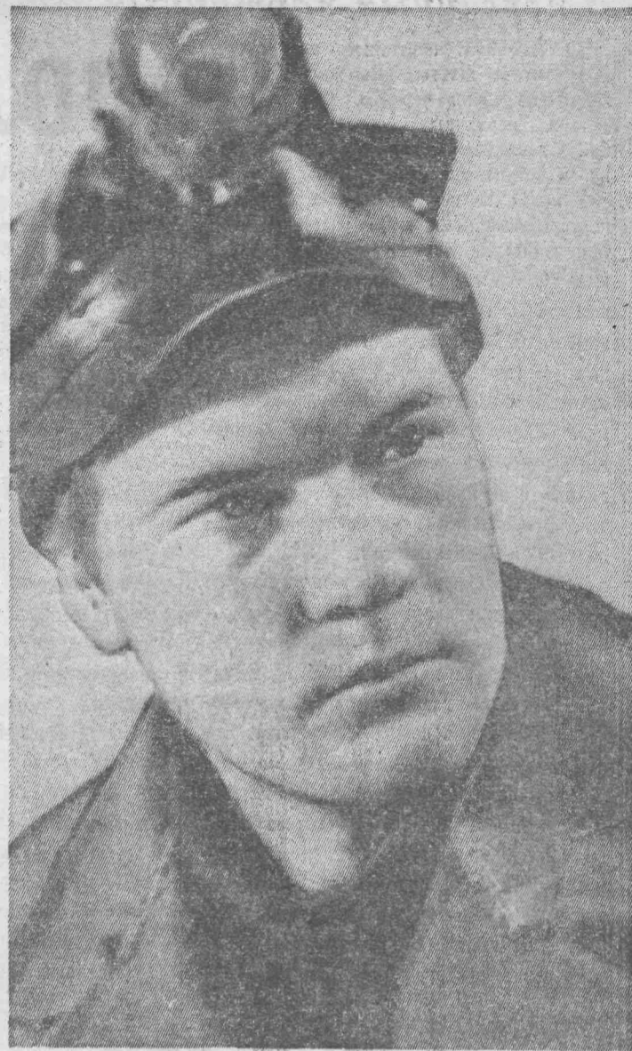
На шахтах нашего рудника становится все больше «железных» лав. Угольные комплексы берут на себя основную тяжесть шахтерского труда.

ВЛАДИВОСТОК. (ТАСС). Из огромного водохранилища, которое разольется с постройкой первой на Дальнем Востоке ГЭС Зейской, ежегодно можно будет вылавливать до 20 тысяч центнеров рыбы. Это составит четвертую часть современного улова пресноводных рыб в Амурской бассейне. Чтобы быстрее шло заселение водохранилища, в районе будущей плотины намечено построить инкубационный завод на 50 миллионов икринок в год.