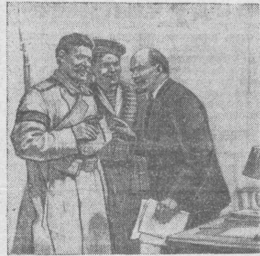
В. И. Ленин беседует с красногвардейцем в Смоленском.

Поздно вечером в тот же день Владимир Ильич прибыл в Смоленский, чтобы непосредственно руководить восстанием.