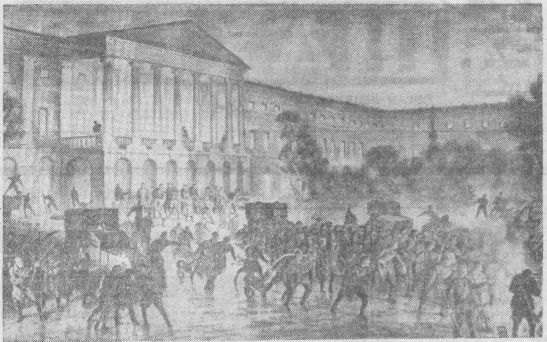
Фрагмент картины художника В. А. Кузнецова. «Смоленский в Октябрьские дни».