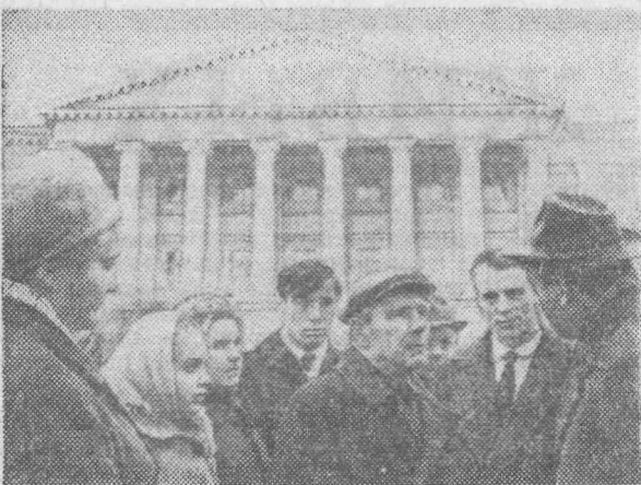
Тысячи ленинградцев, экскурсантов из всех городов и сел нашей Родины, многочисленные зарубежные гости приходят к стенам исторического здания, посещают комнату-музей В. И. Ленина,

Но оставалось еще гнездо контрреволюции — Зимний дворец, где отсиживались министры Временного правительства.