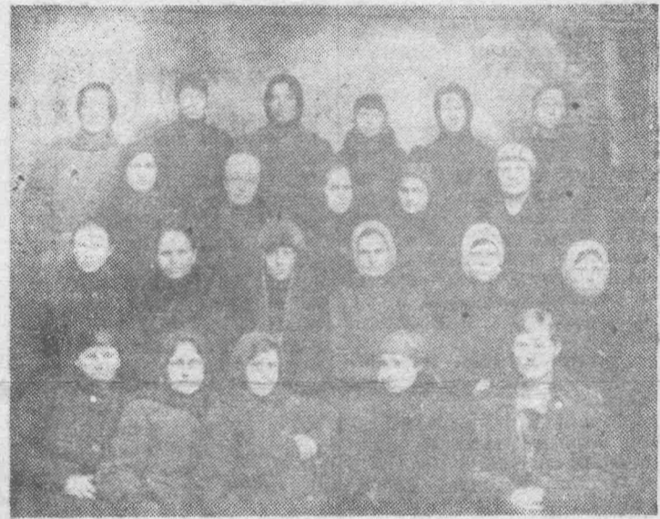
Эта фотография начала 20-х годов. На ней делегатки женотдела.