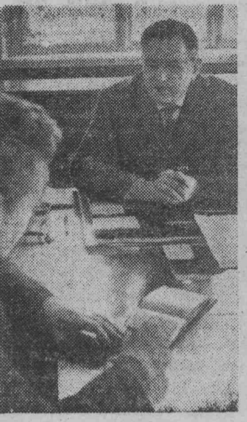
На снимке: О. К. АНТОНОВ.

В 1924 году 18-летним юношей О. К. Антонов вместе со своими сверстниками построил первый планер. Прошло 42 года. Сейчас за плечами генерального конструктора по авиационной технике О. К. Антонова десятки конструкций планеров и самолетов. Среди них всемирно известные — двухкрылый АН-2, турбовинтовые АН-10, АН-24 и, наконец, самый большой, самый грузоподъемный и вместительный самолет в мире АН-22 («Антей»). С нынешнего года в серию запускается еще один АН — легокрылый грузеник АН-14 («Пчелка»).