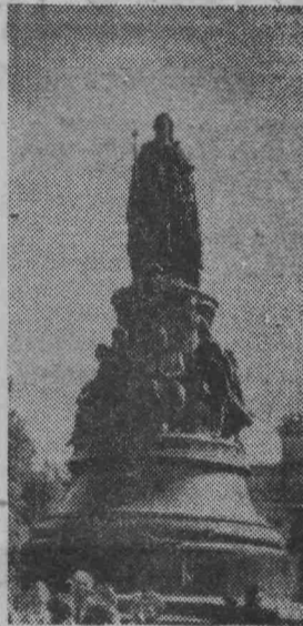
Ленинград Памятник Екатерине I.

лезнодорожного транспорта, имеющим бесплатный проезд и предоставившим об этом справку, из стоимости путевки исключается стоимость железнодорожного билета.