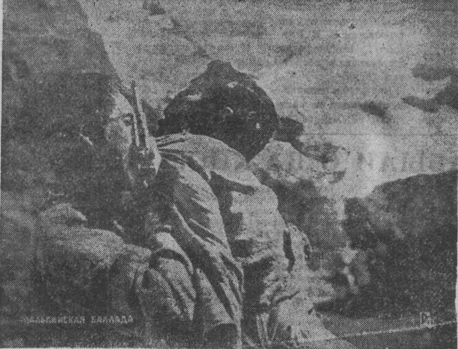
Сегодня вы увидите на экране кинотеатра «Победа» новый художественный фильм Белорусской киностудии «Альпийская баллада» по одноименной повести В. Быкова. Автор сценария В. Быков, режиссер-постановщик Б. Степанов, оператор А. Заболотский.

Доставка газет в настоящее время производится регулярно».