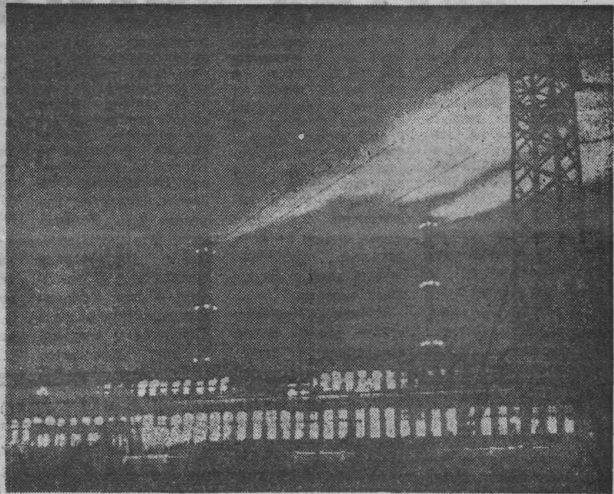
ОГНИ ВАСИЛЕВИЧСКОЙ ГРЭС.