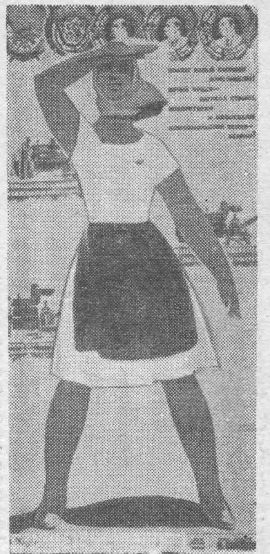
Подвиг новый свершен комсомолом! Пятый орден — награда страны. Покорителям и новоселам Комсомольской земли — целины!