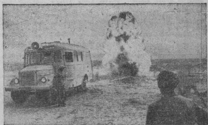
ТУРКМЕНСКАЯ ССР. В бескрайних песках пустыни Каракум обнаружены крупнейшие залежи природного газа. Разведчики недр открывают все новые и новые запасы голубого топлива. Оно будет питать строящуюся топливную артерию страны — газопровод Средняя Азия — Центр.

На снимке: взрыв, записанный сейсмографами, расскажет участникам Бахордской геофизической экспедиции о местонахождении газоносных пластов.