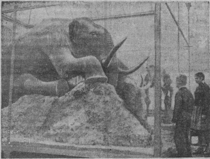
ЛЕНИНГРАД. Березовский мамонт, найденный в начале нынешнего века у притока Колымы. Благодаря вечной мерзлоте он сохранился с мясом и кожей. Экспонируется в мамонтовом зале музея Зоологического института Академии наук СССР.

А. ПЕТРОВ, начальник управления коммунального хозяйства».