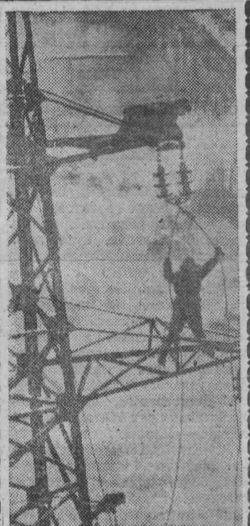
На снимке: монтаж новой линии электропередачи. Промышленность и сельское хозяйство страны получают еще миллионы киловатт-часов электроэнергии.