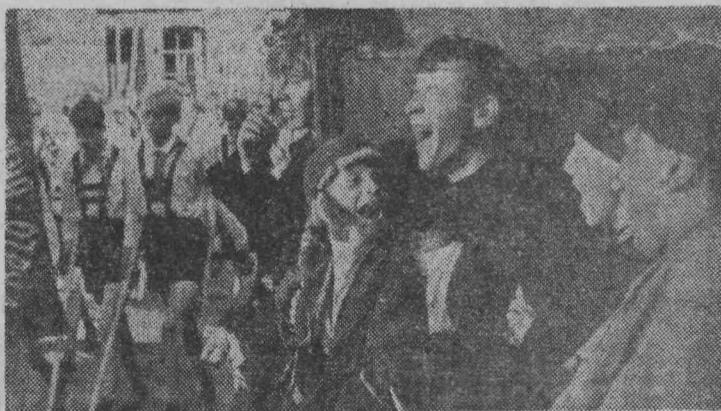
Кадр из фильма.

ке Шкид с течением времени меняются. Нелегко было победить романтику уголовщины. Викниксор хорошо понимал натуру своих питомцев, их склонность ко всему острому, необычному, яркому. Поэтому он и старался изо всех сил увлечь их все новыми, оригинальными и причудливыми затеями. Ребята на первых порах относились к ним довольно насмешливо, но понемногу втягивались в изобретенную Викниксором своеобразную педагогическую игру. Так были придуманы школьная газета, затем герб и гимн школы, потом самоуправление — республика.