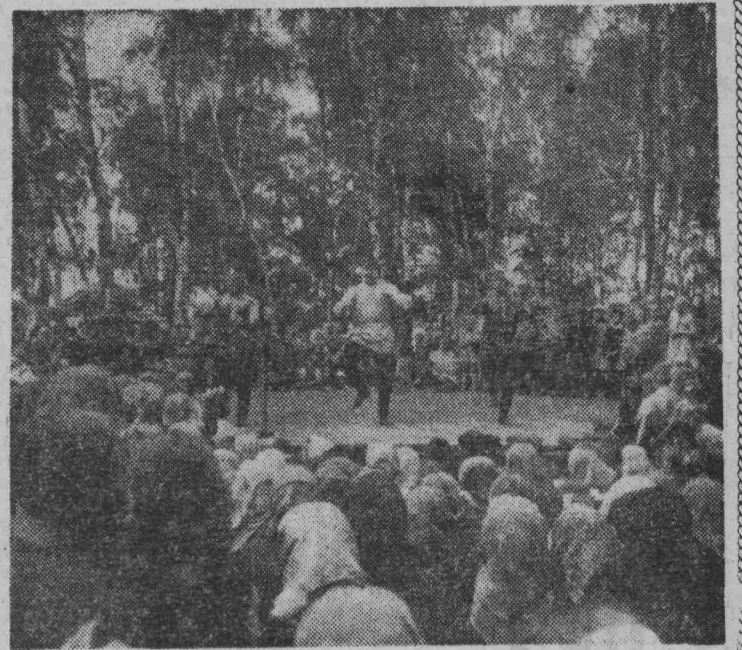
Русский перепляс. Выступление танцевального коллектива шахты «Полысаевская-3».