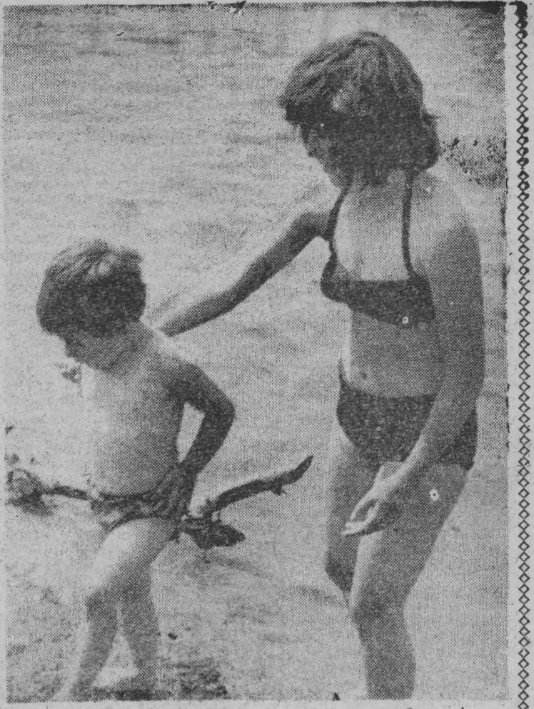
...пусть всегда будет мама, пусть всегда буду я!

Владимир БОРОЧАНЦЕВ, корреспондент ТАСС. БАМАКО.