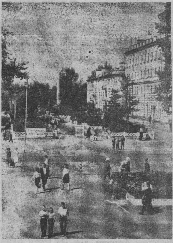
ПЛОЩАДЬ ПОБЕДЫ

Рождались цеха и дети, В труде рождались рекорды. Когда полыхало в огне, В великой войне пол-Европы, Наш город работал вдвойне, За тех, кто ушел в окопы.