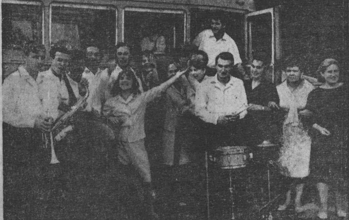
На снимке: агитбригада перед поездкой.