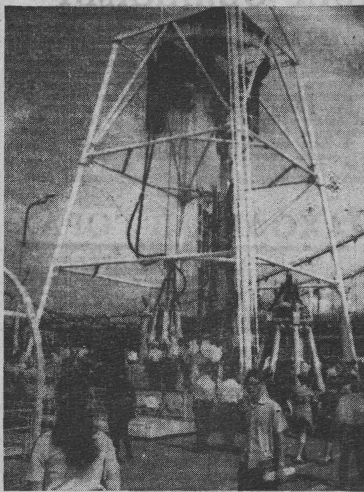
На снимке: агрегат для проходки стволов (СССР).

В советском разделе также полно были представлены комплексы и отдельные виды гидрофицированной крепи, выпускаемой у нас серийно: такие, как 2М-87, МК, КТУ и другие, ко-