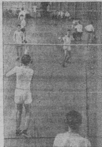
Рязань. Отличный спортивный зал получили физкультурники Рязанского завода тепловых приборов.

Недавно в этом зале прошли Всесоюзные соревнования по бадминтону.