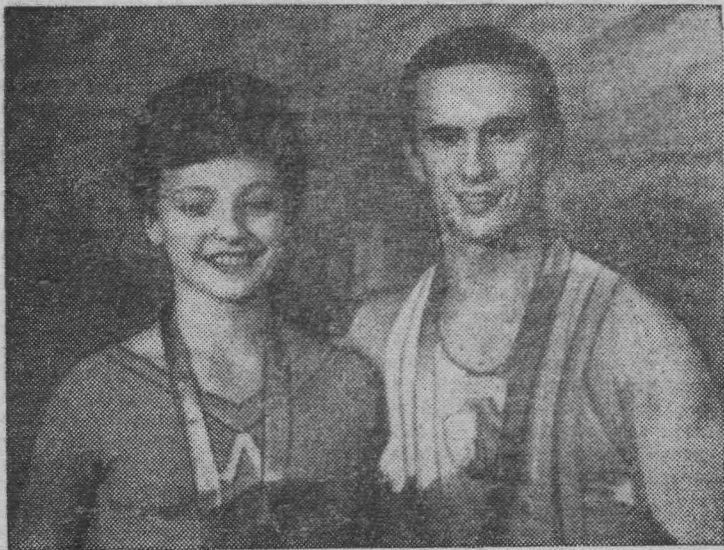
Москва. На IV Спартакиаде народов СССР, посвященной 50-летию Великого Октября, в соревнованиях по спортивной гимнастике абсолютными чемпионками стали ленинградка Наталья Кучинская и москвич Михаил Воронин (на снимке).