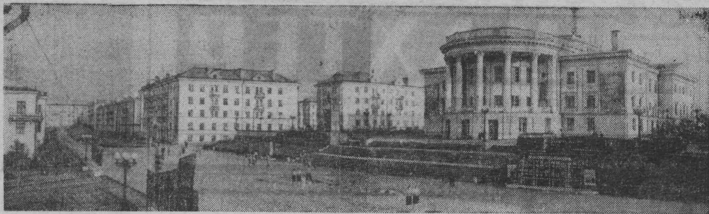
Челябинская область. Город Сатка. За последние годы для рабочих завода «Магnezит» и для строителей здесь возведено большое количество благоустроенных жилых домов, Дворец культуры, несколько клубов, кинотеатров, школ, магазинов и других культурно-бытовых учреждений.

Обслуживанием населения занято около 22 миллионов человек, каждый четвертый работник народного хозяйства. В перспективе в этой сфере будет занята примерно треть всех работающих. Сегодня индустрия удобств оказывает населению около 400 различного вида услуг.