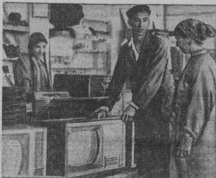
Туркменская ССР. В универмаге колхоза «Мир» Ашхабадского района.

Обслуживанием населения занято около 22 миллионов человек, каждый четвертый работник народного хозяйства. В перспективе в этой сфере будет занята примерно треть всех работающих. Сегодня индустрия удобств оказывает населению около 400 различного вида услуг.