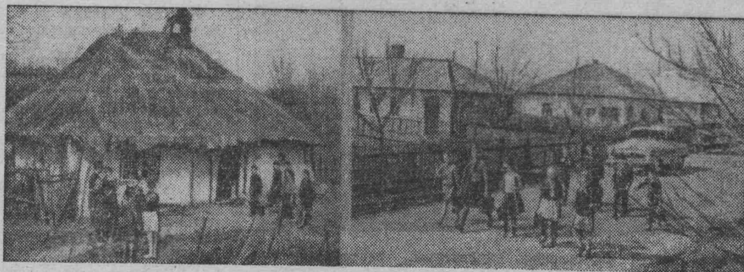
Ивано-Франковская область. Неузнаваемо изменились села Прикарпатья за годы Советской власти. Только за последние несколько лет в колхозном селе Стецева Снятынского района построены Дворец культуры, средняя школа, поликлиника и больница, гостица, столовая. Почти все колхозники переселились в новые благоустроенные дома.

Сейчас принимаются энергичные меры по устранению имеющихся недостатков. В частности, организован Всесоюзный институт по изучению спроса и конъюнктуры торговли. Он будет заниматься научным планированием производства и распределения товаров. Серьезное внимание обращается на улучшение работы рынков. Приняты новые правила торговли на них, удобные и для продавцов и для покупателей.