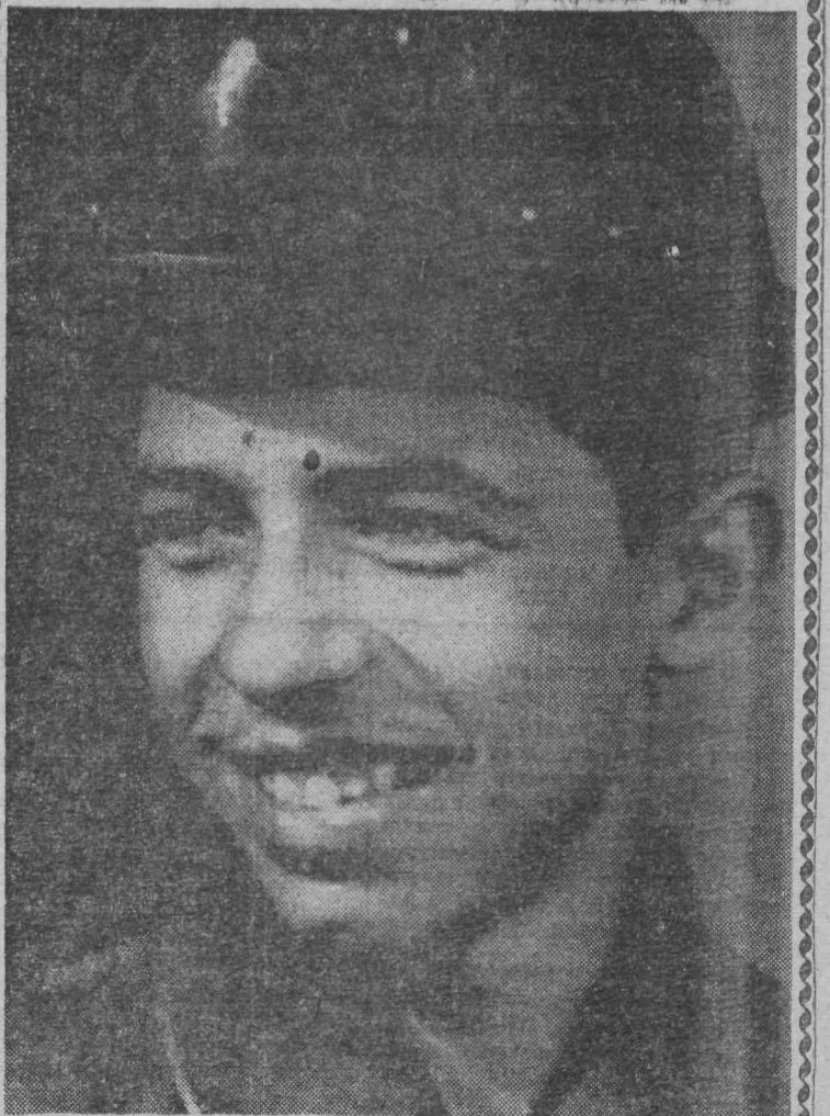
МОЛОДОЙ ГОРНЯК.

«ЛЕНИНСКИЙ ШАХТЕР» 23 августа 1967 г., № 167, стр. 3