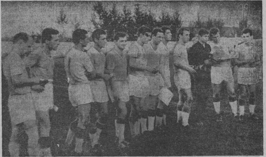
На снимке: футбольная команда шахты «Полысаевская-2».

ков. Игра становится неинтересной и неспортивной. Ярославцы так и не смогли за целый тайм использовать свое численное преимущество. Счет мог бы измениться, но полысаевцы не смогли прицельно завершить свои красивые атаки, а ярославцы били по воротам точно, сильно. Но безупречная игра вратаря полысаевцев Геннадия Казадуба не позволила им открыть счет. Итак, определились три полуфиналиста: команды шахты имени 7 ноября, «Энергия» и шахты «Полысаевская-2», П. ШАНДУРА,