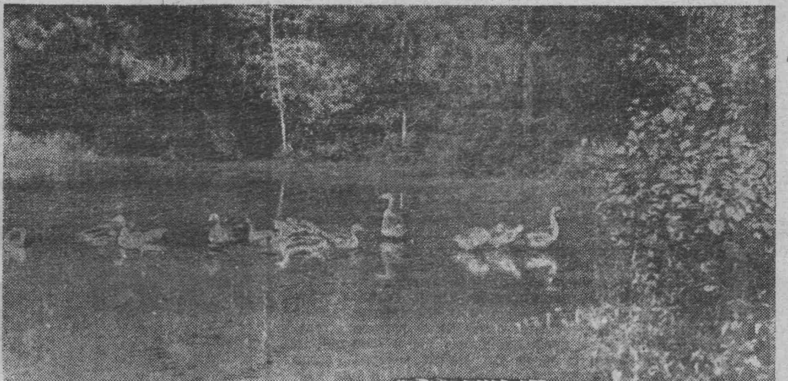
В тени лесного пруда.