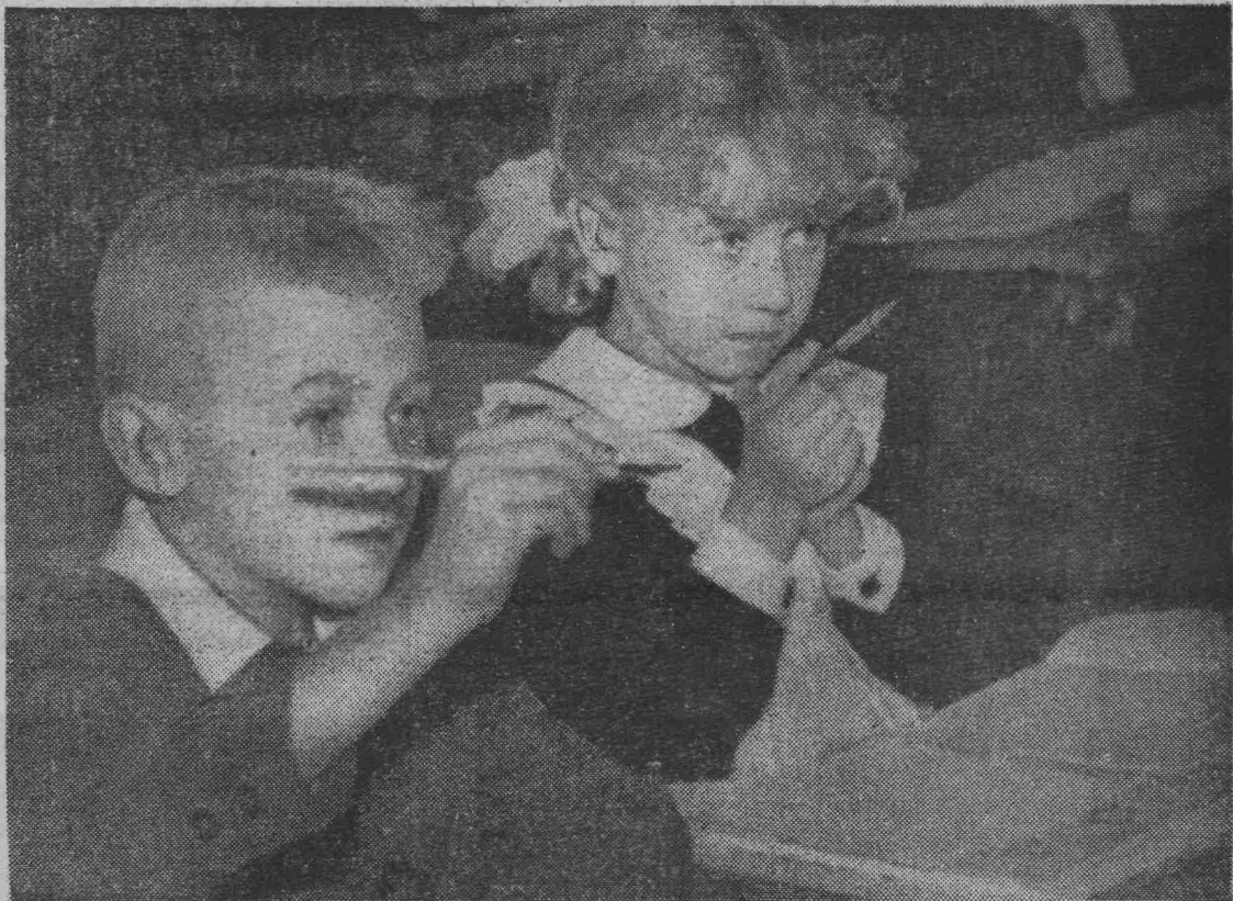
КАК ПИШЕТСЯ ПЯТЕРКА