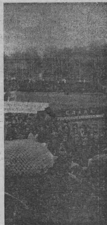
На снимках: сверху — шестидесятилетняя молодежь, внизу — партийное собрание приветствуют пионеры.