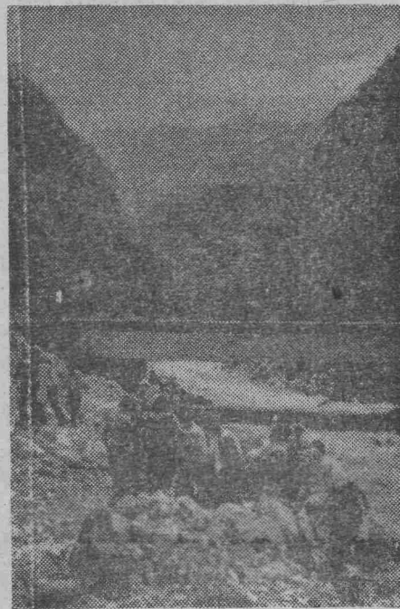
На снимках (сверху вниз): ГАГРЫ. Пальмовая аллея Гагрского парка; РИКА. Мост через реку Гегу по дороге на озеро Рика.