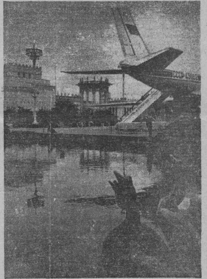
На ВДНХ СССР. Слева павильон «Советская культура»