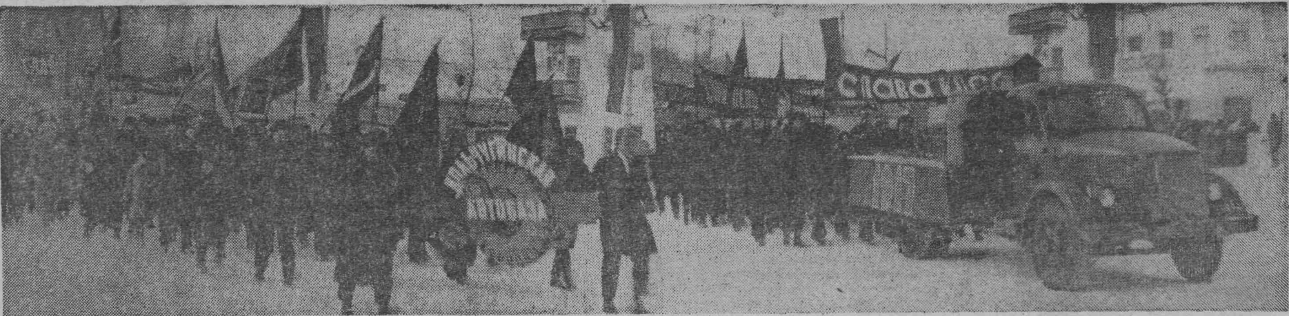
На праздничной демонстрации в нашем городе.