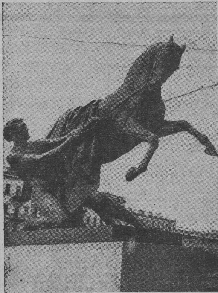
ЛЕНИНГРАД. Одна из четырех скульптурных групп работы П. Клодта, украшающих Анничков мост.