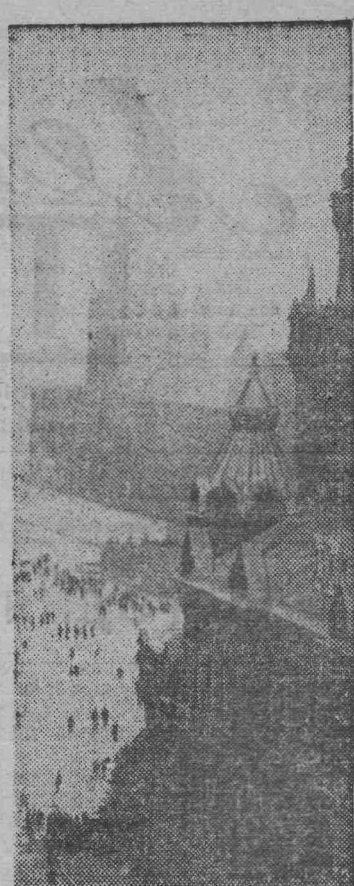
Москва. Вид на Красную площадь.