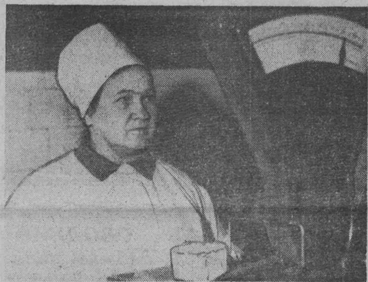
Эта женщина в белом халате знакома всем, кто живет в центре города, всем, кто посетил хотя бы однажды «Гастроном» № 5.

Воскресный день, как по заказу, был теплый, солнечный. Ночью выпал первый снег. Озорные ребята встретили зиму шумом, веселым задором, игрой в снежки. Затем, бросив свои увлечения, пулей понеслись по улице, извещая всех: