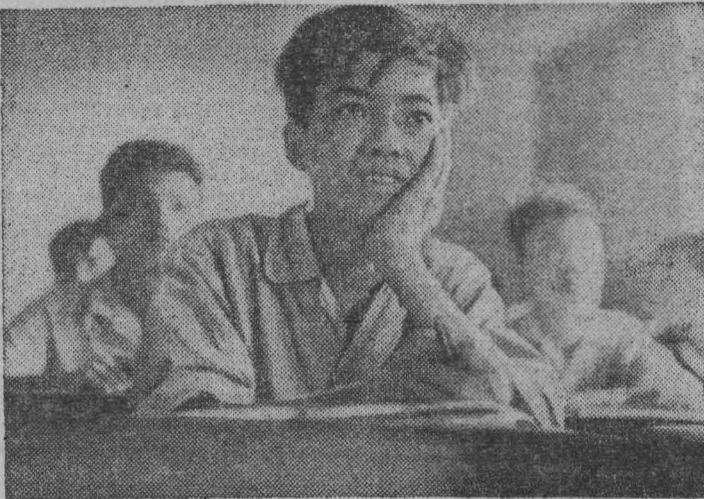
На верхнем снимке: Берлин. Столица ГДР. На улице Унтер-ден-Линден.

Демократическая Республика Вьетнам. Свыше 5 миллионов детей и взрослых посещают занятия в школах Вьетнама.