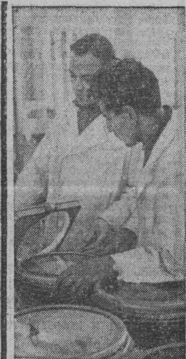
Завод «Теплоконтроль» — передовое предприятие Татарии. «Пятилетку — досрочно!» Этот призыв передовых предприя-