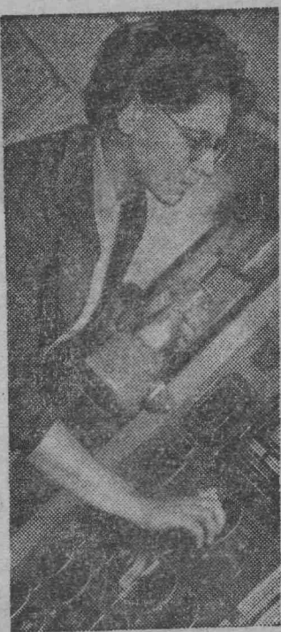
МОСКВА. В лаборатории сушки сельскохозяйственных продуктов Всесоюзного научно-исследовательского института механизации сельского хозяйства (ВИМ) проводят исследования режимов сушки, охлаждения и вентилирования семян различных культур. В результате созданы методы расчета конструкций зерносушилок и разработаны рекомендации по эксплуатации сушилок и установок для активного вентилирования зерна.

Лаборатория создает новую технологию обработки зерна высокой влажности на сушильно-считистельных пунктах и заводах. Применительно к этой технологии создана шахтная сушилка СЗСК-4 с «мягким» режимом сушки, необходимым для семян, подверженных растрескиванию (рис, кукуруза, горох и др.).