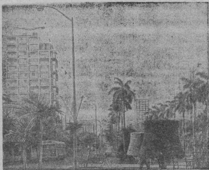
Гавана — столица Республики Кубы.