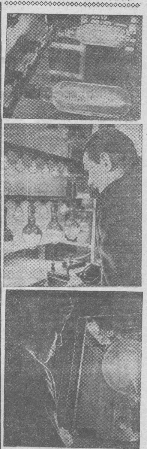
Московский завод электровакуумных изделий выпускает десятки наименований радиоламп, телевизионных трубок, фотоэлементов.

Но есть на предприятии цех, где изготавливаются необычные лампы накаливания. На верхнем снимке вы видите лампу, которая дает свет в виде светового шнура. Эта лампа используется при распиловке бревен на лесопильной раме.