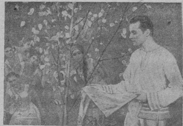
Саранск. Работники культуры Мордовии готовятся к 50-летию Советской власти.

Олег ПЛЕШОВ, корреспондент ТАСС, КОЛОМБО.