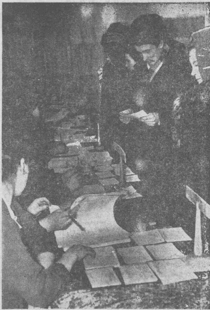
Выдача бюллетеней на избирательном участке № 8.