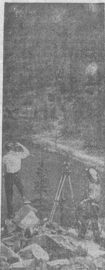
На снимке: дальневосточные разведчики недр на таежном озере Амут.