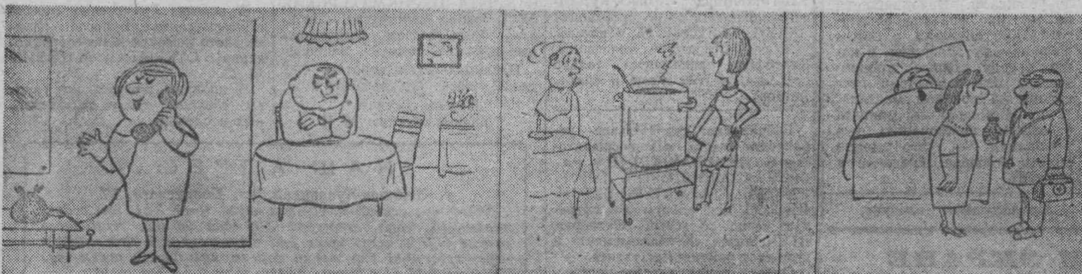
— Подожди две минуты у телефона, я только накормлю его!