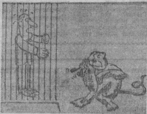
— По Дарвину мы с тобой двоюродные братья, но ключ все-таки отдай.

Джон: Извините, пожалуйста, я должен был вымыть шею и уши. Но, честное слово, этого больше не случится.