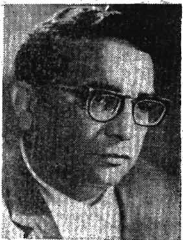
На снимке Караев К. А., композитор, народный артист СССР. Премия присуждена за музыку балета «Тропюю грома».

— Меня привлекла возможность, — рассказывает Кара Караев, — сплести вечную тему любви с острой современной темой борьбы колониальных народов за свободу и свое человеческое достоинство, против расизма. Трагична судьба молодого учителя — негра Лен-