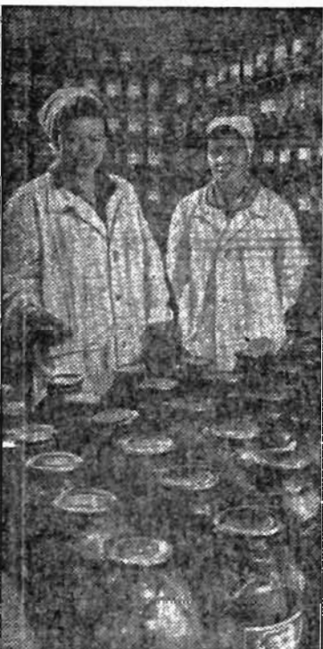
ЛЕНИНСК. Консервный завод. Здесь вырабатывают более 50 видов овощных и фруктовых консервов

Экскурсионный автобус идет по улицам города. Это нужно людям. Они должны знать историю родного города. С. НИКОЛАЕВ.