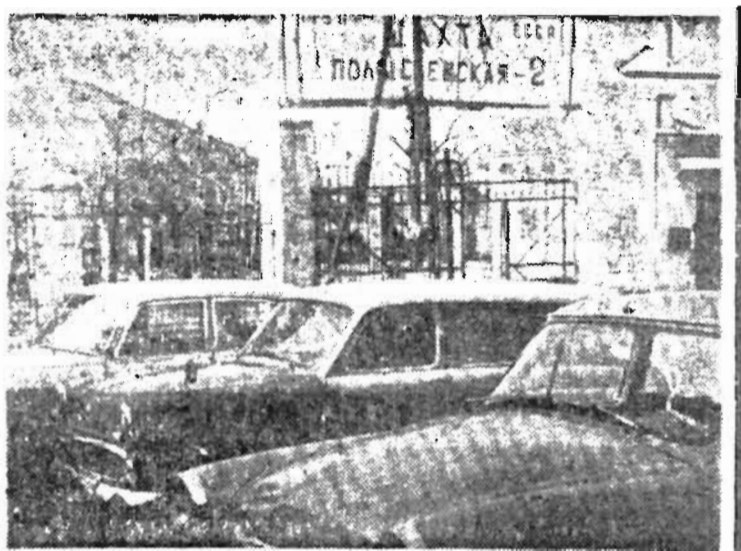
Такую картину можно постоянно видеть у административно-бытового комбината шахты «Подсаевская-2». Это личные машины горняков.

Материал подготовил инженер БРИЗа треста «Ленинуголь» В. СТРАТОВИЧ.