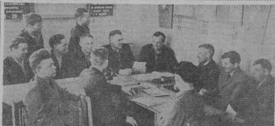
В юбилейном социалистическом соревновании в честь 50-летия Великого Октября отлично трудится коллектив участка подземного транспорта шахты «Комсомолец».

Памятник будет сооружен на средства, заработанные комсомольцами и молодежью города на массовых воскресниках.