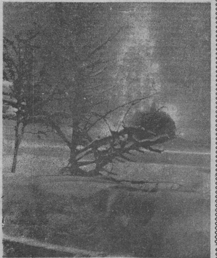
В новогоднюю ночь.