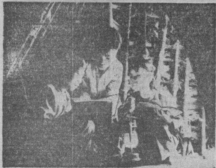
ДЕМОКРАТИЧЕСКАЯ РЕСПУБЛИКА ВЬЕТНАМ. На юге страны, где американская авиация продолжает бомбардировки, школьники занимаются в бомбоубежищах.